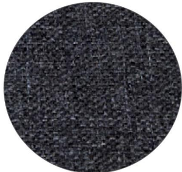
1. Gris / Grey