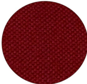
2. Burdeos / Burgundy