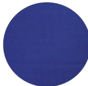
3. Azul / Blue