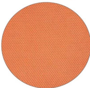
5. Naranja / Orange