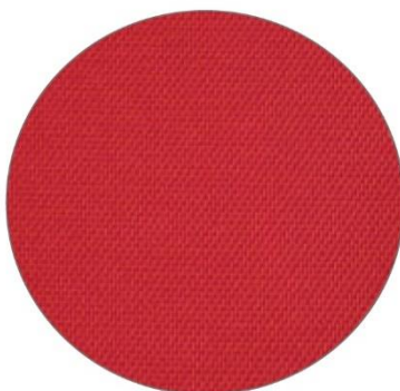
2. Rojo / Red