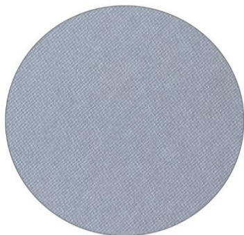
1. Gris / Grey