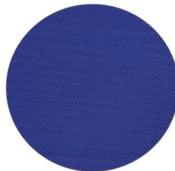
3. Azul / Blue