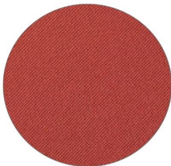
2. Rojo / Red