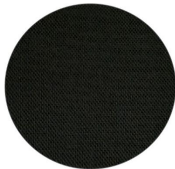
4. Negro / Black