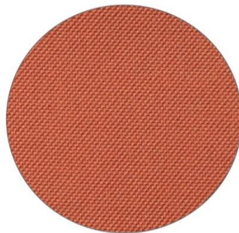
5. Naranja / Orange